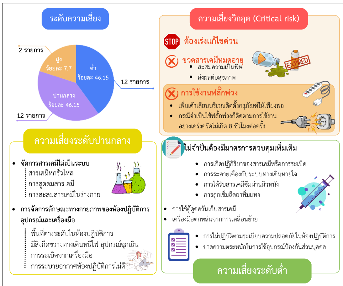
ภาพที่ 2 แสดงผลการศึกษาโดยสรุปการสำรวจ ชี้บ่งอันตราย และประเมินความเสี่ยงห้องปฏิบัติการชีววิทยา

เกิดจากการใช้เครื่องมือหรืออุปกรณ์ไม่ถูกต้องตามวิธีการใช้งาน และการวางอุปกรณ์ไม่มั่นคง หรือจัดพื้นที่ทำงานไม่เหมาะสม การป้องกันโดยการตรวจสอบสภาพเครื่องมือและอุปกรณ์ก่อนใช้งานอย่างสม่ำเสมอ และให้ความรู้เกี่ยวกับการใช้อุปกรณ์อย่างถูกวิธี และความเสี่ยงด้านการปฏิบัติตามข้อกำหนดในห้องปฏิบัติการ จำนวน 6 รายการ ประกอบด้วย 1) สารเคมีหกรดร่างกาย กระเด็นเข้าตา 2) การถูกของมีคมบาด 3) การถูกความร้อนจากการใช้งานเครื่องมือ 4) การรับสารเคมีเข้าสู่ร่างกาย 5) การหกล้ม 6) อาการผื่นแพ้ สาเหตุเกิดจากการไม่ปฏิบัติตามระเบียบความปลอดภัยในห้องปฏิบัติการ และขาดความตระหนักในการใช้อุปกรณ์ป้องกันส่วนบุคคล มาตรการป้องกันและแก้ไขโดยให้การปฐมพยาบาลเบื้องต้น และปรึกษาแพทย์เมื่อเกิดอุบัติเหตุ ฝึกอบรมและสร้างความรู้เกี่ยวกับการใช้อุปกรณ์ป้องกันส่วนบุคคล และส่งเสริมการปฏิบัติตามข้อกำหนดด้านความปลอดภัยในห้องปฏิบัติการอย่างเคร่งครัด